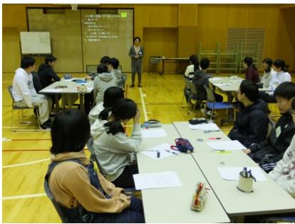
2月月例研修（マナー研修）