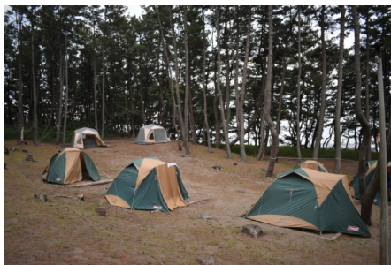
就寝時間(テント泊)