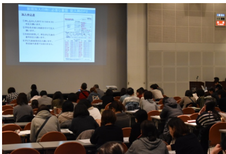
安全共済会加入説明会

4月4日（火）、すみだリバーサイドホールで、子ども会安全共済会加入説明会を行いました。今年はいよいよわかりやすく説明をするために、スライドを使って説明をしました。当日の説明用スライドは、ホームページに公開しましたので、書類を作成する際の参考にしてください。