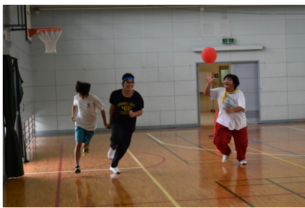
運動会・全員リレー

二日目に行われた運動会では、チームに分かれてさまざまなプログラムを行い得点を競いました。最後は、全員リレーでしたが、バトンが「人」「風船」「大きなボール」と、面白く楽しさ満載の運動会でした。