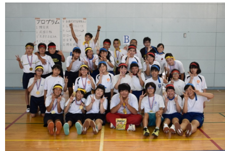
運動会後の集合写真

万が一、事故が起きた時は、速やかにご連絡いただき、事故報告書を提出してください。ご不明な点がございましたら担当までお気軽にお問い合わせください。