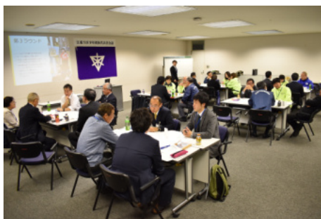
江東五区少年団体代表者会議

今後に向けた新しい提案がなされるなど、江東五区の少年団体の皆様と有意義な意見交換ができました。