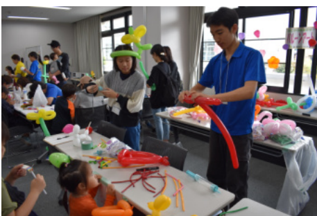
JL派遣(バルーンアート)