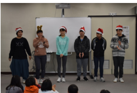
JL派遣(クリスマス会)

この6年間を振り返ると辛かったことももちろんありますが、楽しかった思い出の方がその何倍もあり、続けてよかったなと思っています。