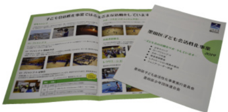
子ども会活性化事業紹介パンフレット

4月以降、各子ども会などに配布しますので育成者の皆様に回覧していただき、子ども会活動に役立ててください。パンフレットは、当連合会ホームページにも掲載しています。