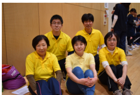
ビーチボールバレー大会

平成31年2月23日(土)、小学校PTA協議会主催の教育長杯ビーチボールバレー大会に招待していただき、墨少連チームとして参加しました。選手の平均年齢はおそらくトップですが、結果は2勝2敗と奮闘し、みんな仲良く楽しくプレーしました!