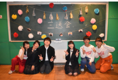
リーダー3級を送る会

習で培われた知識、話し合いする上でのコミュニケーション能力、子供達の、人の気持ちを汲み取る力、きつと普通の学生生活では経験できない大事な大事なことを得られたと感じています。なによりなんでも話せる、一緒にいて一番楽だと思える、そんな友だちが多くできました。ジュニア・リーダーに上下関係はありません。先輩も先輩もみんながみんな、一人一人を個性ある人間だと見てくれます。自分が変わって行くから、人見知りだから、そんなものジュニア・リーダーでは関係ないのです。