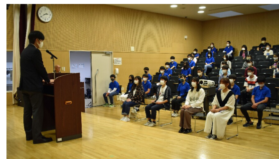
2020年9月 修了証授与式

対象：4月に新中学1・2年生となる区内在住・在学の方 募集要項など詳しくは、当連合会ホームページをご覧ください。