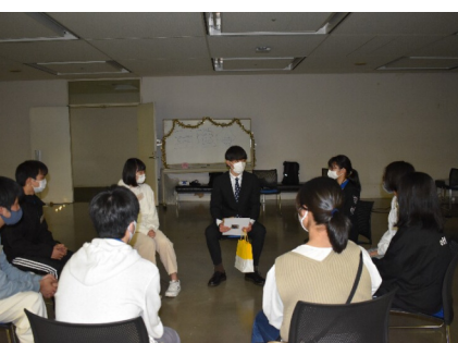
2021年3月 リーダー3級を送る会

うまくできずよく落ち込んでいましたが、回数を重ねていくにつれて、回数が増えいくうれしさを知り、勇気づけられました。リーダー級になると一つ一つの仕事に責任を感じ、また学校との両立でも大変でしたが、その分やりがいもたくさん達成感があり、楽しんで最後までやりとげることができました。改めてこの6年間は、私にとって大きな経験であり、それを糧にこれからも頑張っていきます。また、今まで支えてくださった育成者の方々、ありがとうございます。