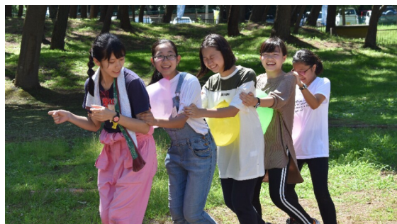
2019年夏 研修キャンプ

これがどこの誰に読まれるのかわかりませんが、私の思ったことを好きなように自由に書いていこうと思います。 正直、ジュニア・リーダーは周りの人にあまり理解して