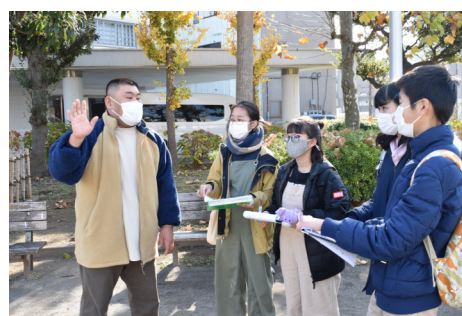
2020年12月 研修「ウォークラリー」