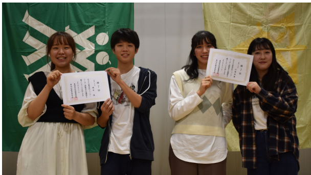
令和元年度 修了・卒業生メッセージ

修了生・卒業生からジュニア・リーダーに入って良かったことや思い出、後輩へのメッセージを寄稿していただきました。 「お金が出ない活動です。『お金が出ないのによくできるね』とか『なにそれ変だね』とか言われることもあり。ななでこの活動をしているんだろ？と考えることもあるかもしれません。それでも、私は続けてよかったと胸を張って言えます。なぜなら、たくさん成長でき、できることも増え、なによりも素敵な出会いに溢れていたからです。ジュニア・リーダーをやっていたからできたことや気づけたこと、きっとこれからの生活にも生きていくのだと思います。ななが言いたかったら、墨田区ジュニア・リーダーズクラブという活動に出会えたあなたは幸せ者であるということです。