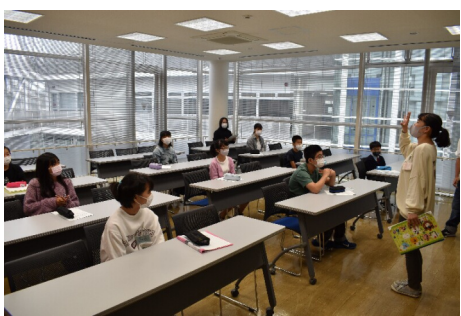
2020年10月 新入生ガイダンス

まずはジュニア・リーダーに入ろうと思ったきっかけは小学生のころから続いていたサブリーダーの延長だったからです。サブの活動が楽しく、その続きという気持ちで中学時代は過ごしていました。が、本当に楽しかったのはリーダー級になってからでした。みんなを楽しませる企画を考えて話し合いながら企画を書いたり、育成さんたちと一緒に現実的なキャンプの運営をしたりと、サブ時代に憧れていた班つきリーダーのような仕事ができてもうれしかったです。短い高校生活の中でも最も大きな思い出の一つとなっています。サブ時代の友だちももちろんいますが、ジュニアに入ってから出会った友だちや先輩、先輩は6年間の最も大きな財産です。